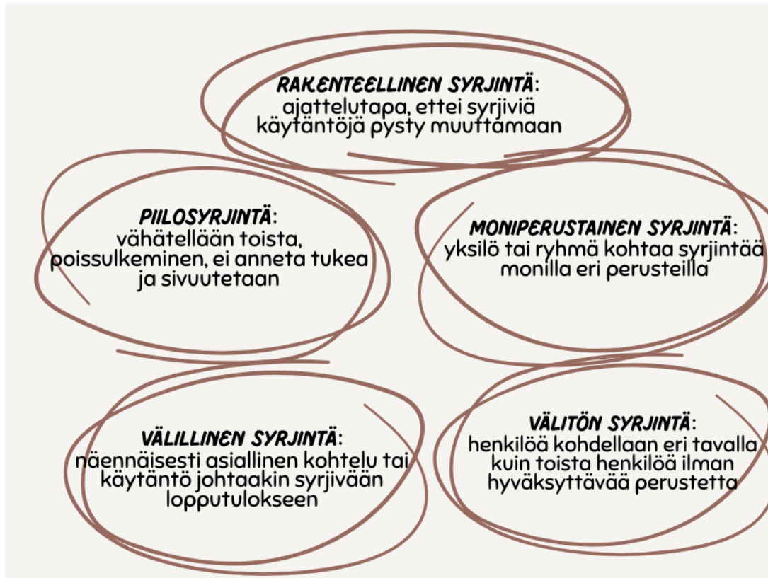
Kuva 1 Syrjinnän eri muodot