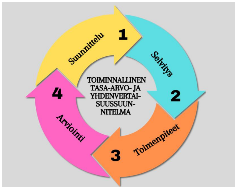
Kuva 2 Toiminnallisen tasa-arvo- ja yhdenvertaisuussuunnittelun prosessi